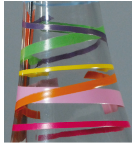
Alta densidad y contornos muy definidos con SEFAR PA