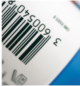
Impresión de códigos de barras de alta densidad y con bordes muy definidos con SEFAR PA