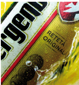
Impresión de carteles retroiluminados con semitonos de más de 30 líneas/cm con SEFAR PET 1500

El rendimiento de SEFAR PET 1500 es impresionante en una amplia variedad de aplicaciones, que van desde la serigrafía gráfica de tamaños grandes o pequeños (como carteles, visores y señalizaciones), impresiones sobre plásticos (como en artículos deportivos, piezas termoformadas, etc.) a la decoración de cerámicas, directa o indirecta, así como en impresiones de tejidos y otras tareas de impresión industrial.