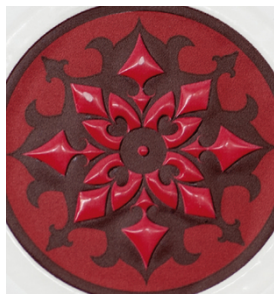
Para lograr exclusivos barnices transparentes en etiquetas impresas con SEFAR PET 1500