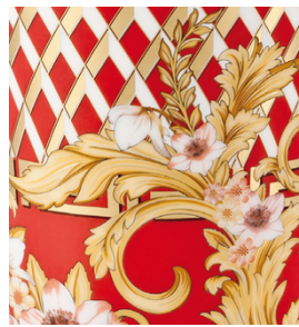
Excelente reproducción de detalles en las calcomanías de cerámica impresas