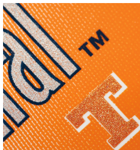
Impresión de textos con bordes muy definidos y gran legibilidad en etiquetas con SEFAR PCF FC