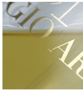
Letras de alta densidad con bordes muy definidos en frascos de perfume con SEFAR PCF