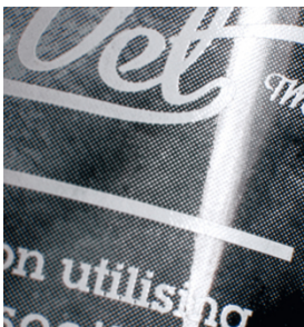
Excepcional calidad de impresión de semitonos pequeños en tubos de plástico impreso

Amplíe sus opciones con SEFAR PCF para la impresión serigráfica en envases de plástico, etiquetas, artículos de vidrio, discos ópticos y muchos otros sustratos de impresión exigentes.