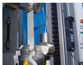
Las bandas de Sefar