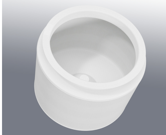
Centrífuga de eje vertical